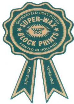
Marque n° 46271 Marque de l'opposant

Attendu que les marques des deux titulaires en conflit les plus rapprochées se présentent ainsi :